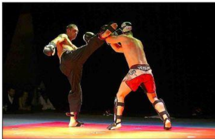
Les représentants des différentes disciplines sur la scène de l'Espace Cathare.