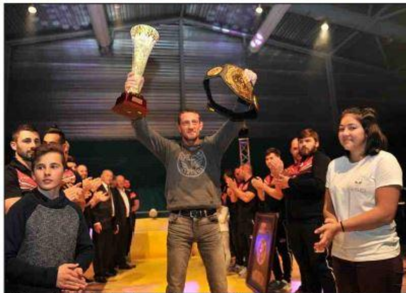
► Le limouxin Christophe Rea, Champion du monde en 2016, présentera une démonstration de pankido-MMA.

Mis en scène par Jean-Philippe Bourrel, le rendez-vous permet de rassembler la grande famille des arts martiaux autour d'un spectacle.