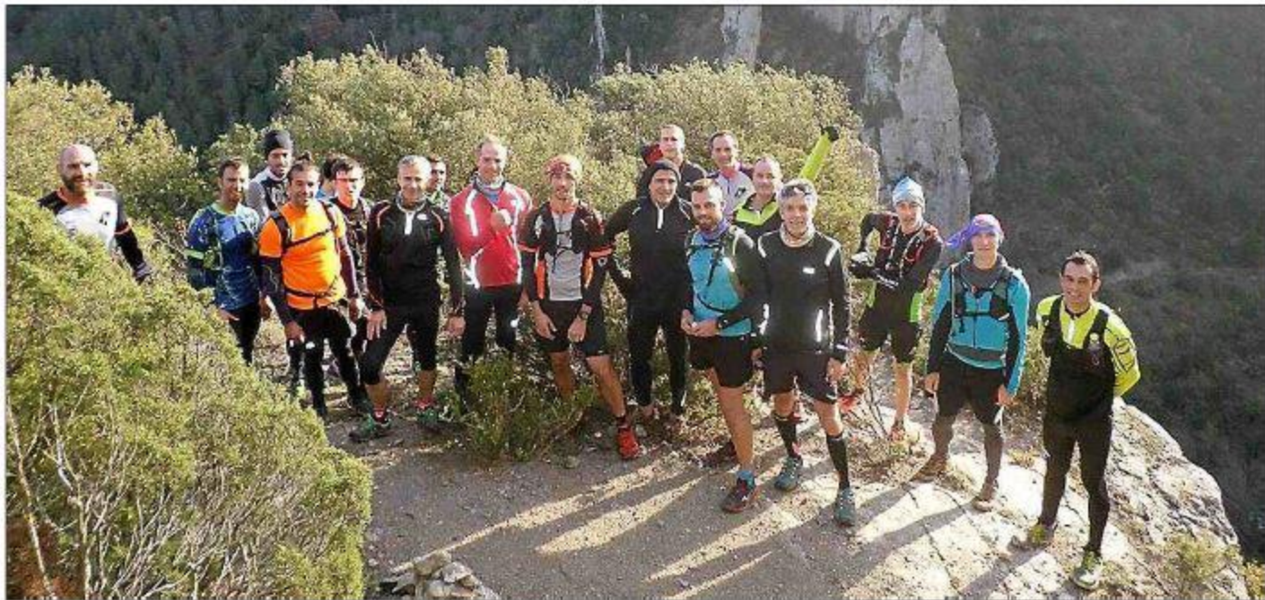
► Le belvédère du Diable offre une vue spectaculaire sur les gorges de la Pierre Lys.

L es Pyrénées audoises et le cirque autour de Quillan présentent de nombreux sentiers de randonnée très prisés par les amateurs du genre. La municipalité de Quillan œuvre depuis déjà de nombreuses années afin d'améliorer ces sentiers à l'aide d'associations et de bénévoles divers. Il existe 6 zones de randonnées autour de la cité des Trois Quilles (6 massifs) organisées en 2, 3 ou 4 sentiers. Le massif de la Pierre-Lys sur Belvianes-et-Cavirac est l'un de ces lieux privilégiés par les randonneurs et promeneurs. C'est la zone de fusion entre le relief des Pyrénées et celui des Corbières avec le concours du fleuve Aude. Les trois sentiers créés sont accessibles au plus grand nombre et conduisent tous à des points de vue d'exception : Pic de Couïrou au-dessus du tunnel et du centre international de séjour de La Forge, le Belvédère de Font Maure