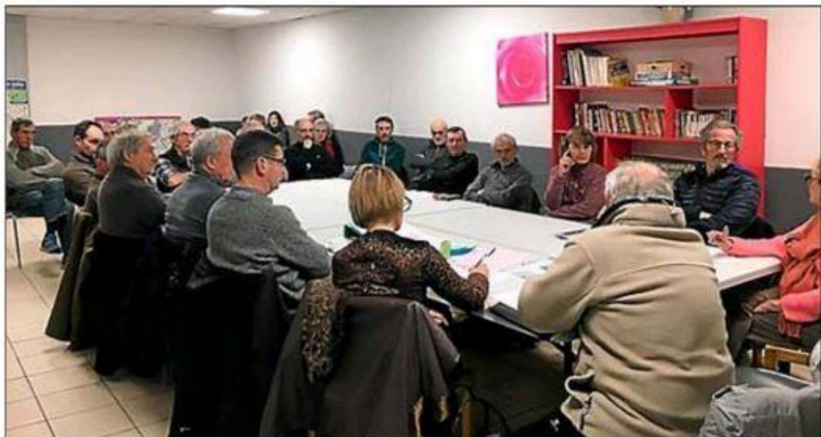
Une trentaine de personnes étaient présentes à la première réunion de l'année.

L'association a pour but premier d'entretenir, baliser et